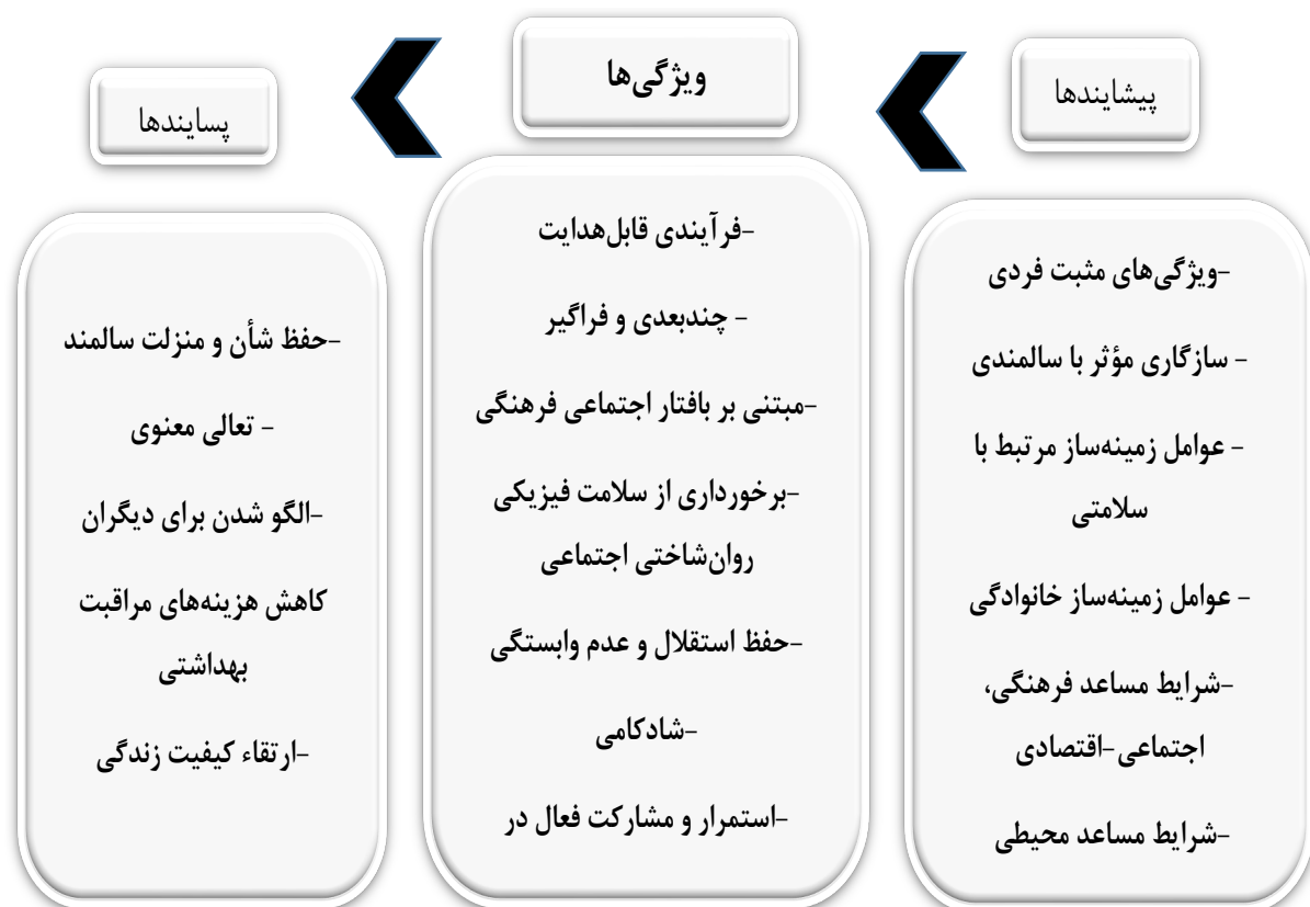
تصویر ۲. نمایش شماتیک مفهوم سالمندی موفق

زندگی زناشویی، اجتماعی و غیره را ذکر کرده بودند. به‌ویژه این ویژگی در مطالعاتی که به تبیین مفهوم سالمندی موفق از دیدگاه افراد مسن پرداخته بودند، با ادبیات مختلفی در بیانات مشارکت‌کنندگان دیده می‌شد که یکی از آن‌ها اصطلاح «کنار نکشیدن از زندگی» بود که بر اهمیت ادامه دادن به زندگی قبلی و کنار نکشیدن از عرصه‌های مختلف زندگی با حفظ نگرش مثبت نسبت به سالمندی و بالعکس لزوم ادامه دادن به فعالیت‌های موردعلاقه، یادگیری چیزهای جدید و داشتن هدف و برنامه برای آینده تأکید می‌کند. در معروف‌ترین مدل موجود برای سالمندی موفق که مربوط به رو و کان است نیز درگیری با زندگی ۴۸ به‌عنوان یکی از عناصر ضروری سالمندی موفق اشاره شده است.