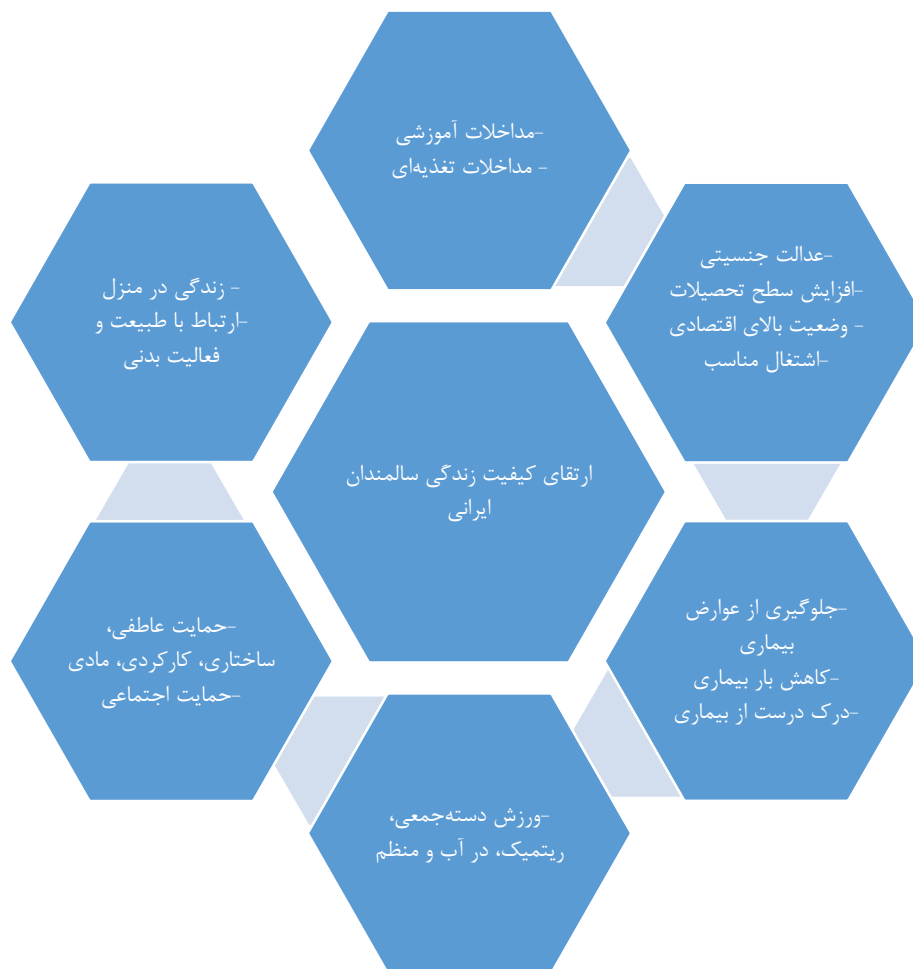
تصویر ۲. موارد ارتقادهنده کیفیت زندگی سالمندان ایرانی