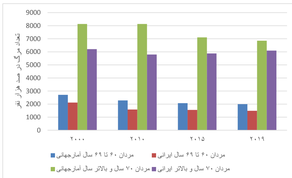
نمودار ۲: میزان کلی مرگومیر مردان در درصد هزار نفر در ایران و جهان بین سال‌های ۲۰۰۰ تا ۲۰۱۹

نمودارهای ۲ و ۳ میزان کلی مرگومیر در درصد هزار نفر در ایران و جهان را بین سال‌های ۲۰۰۰ تا ۲۰۱۹ به تفکیک جنس مقایسه کرده است. این مقایسه نشان می‌دهد که میزان مرگومیر سالمندان ایرانی در هر دو گروه سنی ۶۰ تا ۶۹ سال و ۷۰ سال و بالاتر، در هر دو جنس و در چهار دوره مورد مطالعه از میزان‌های مرگومیر جهانی در گروه‌های مشابه بسیار پایین‌تر است.