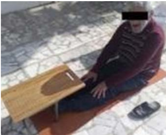
تصویر ۱. آزمون خمش و رسش.