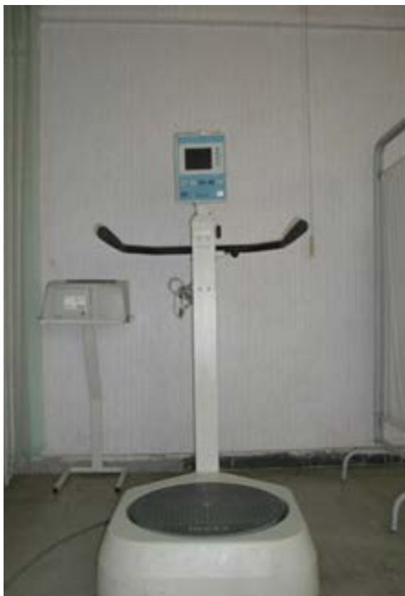
تصویر ۱. دستگاه تعادل سنج بیودکس.