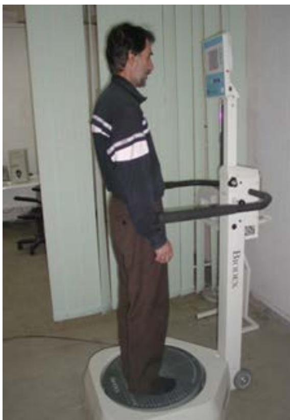
تصویر ۲. نحوی استقرار روی دستگاه.

A (۵۹-۵۰ سال) و B (۶۹-۶۰ سال) پس از انجام معاینات پزشکی و دریافت گواهی از پزشکان متخصص مبنی بر نداشتن مشکلاتی از قبیل بیماری‌های عصبی-عضلانی، سابقه جراحی، متقارن نبودن اندام تحتانی، شکستگی و هرگونه مشکل بینایی و شنوایی، در این مطالعه شرکت نمودند.